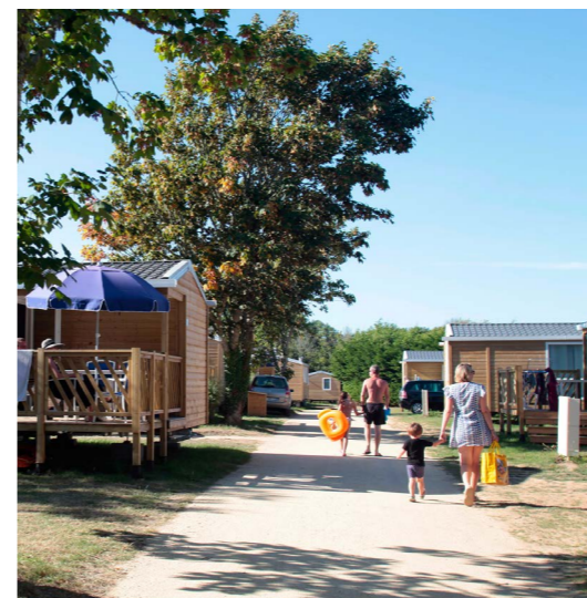
Camping Le Vorlen

Ce sont 15 nouveaux campings qui ont rejoint le réseau cette année. Ils reflètent tous les valeurs de Flower Campings en étant implantés dans des environnements préservés où la nature est omniprésente. Les vacanciers y retrouvent l'accueil chaleureux et l'atmosphère familiale propres aux campings Flower. D'ici à 2028, l'ambition du Groupe est d'accueillir chaque année de 15 à 20 nouveaux campings sur tout le territoire.