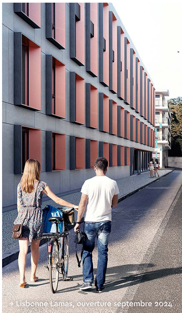
→ Lisbonne Lamas, ouverture septembre 2024

Plus largement, la nouvelle résidence Asprela porte à 28 le nombre de résidences étudiantes Odalys Campus implantées dans les plus grandes villes universitaires françaises mais aussi étrangères. Odalys Campus a d'ores et déjà programmé 13 nouvelles adresses à horizon 2026 en France et à l'international, avec l'ouverture en septembre de la résidence Odalys Campus Lamas à Lisbonne à proximité de l'université Lusíada, ainsi qu'à Grenade et Saragosse en Espagne (septembre 2025) et Liège en Belgique (septembre 2026). Soit l'équivalent de plus de 2 500 nouveaux lits étudiants créés.